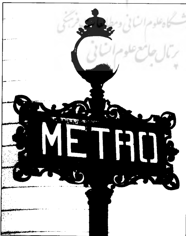
نمونه شماره ۴ برجستگی‌های غیر همسطح