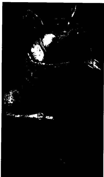
نمونه شماره ۲ اسب چوبی به روی مقوای ۳۰۰ گرمی بافت‌دار

کارهای متعددی در یکی از کاتالوگ‌ها بکار گرفته شده است. برای مثال پلاک‌های مختلف با امکان لتریپرس برجسته شده‌اند. این برجسته سازی همراه با UV موضعی است و به همین خاطر به نظر می‌رسد که واقعاً یک پلاک روی سطح کاغذ چسبانده شده است. صحافی این کاتالوگ با استفاده از چرخ خیاطی انجام شده است بطوریکه حال و هوای کهنگی به آن می‌دهد. ■