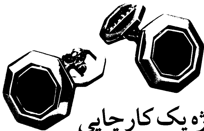
نمونه شماره ۱ شیوه طلاکوب با فویل آبی برای نمایش نکین دگمه سر دست