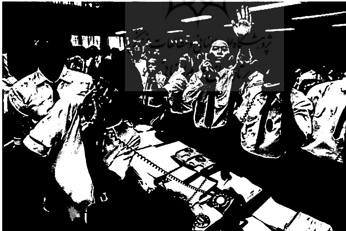
بعد از جنگ‌های هند و پاکستان و درگیری‌های استقلال بنگلادش در سال ۱۹۷۱ دادوستد سهام در بورس داکا برای مدت پنج سال متوقف شد اما دوباره در سال ۱۹۷۶ از سر گرفته شد