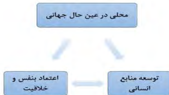
شکل ۱. سه اصل اساسی راهبرد یک روستا، یک محصول (Nobuya, 2013: 32)

راهبرد یک روستا یک محصول با طی کردن سه سطح اولیه، سطح تعمیم یافته و جدید به این سه اصل ذکر شده خواهد رسید. سطح اولیه یک روستا، یک محصول: رویکرد اصلی توسط فرماندار حیراماتسو انجام شد. پاداش به مردم روستایی با تولید و فروش یک محصول که مناسب و قابل قبول برای مردم شهری است. تبیین یک روستا، یک محصول به عنوان "دسترسی روستایی به شهرها" از طریق محصولات منطقه‌ای که زندگی استاندارد جامعه را عمدتاً برای توسعه اقتصاد روستایی هدف قرار می‌دهد. در سطح دوم یک روستا، یک محصول گسترده یا تعمیم یافته است، در این سطح به عنوان "تبادل اطلاعات" از طریق فعالیت‌های منطقه‌ای و به اشتراک‌گذاری اطلاعات برای توصیف منطقه‌ای به عنوان یک هویت منطقه‌ای در چشم‌انداز جهانی است. در سطح سوم که سطح جدید نامیده می‌شود، اطلاعات مربوط به فعالیت‌های یک روستا، یک محصول در سطح بین‌المللی به اشتراک گذاشته می‌شود و به عنوان رویکرد جدید یک روستا، یک محصول "دسترسی شهری به روستایی" تبلیغ می‌شود و از طریق محصولات ممکن و قابل قبول (کالاها و فرهنگ) برای شهروندان شهری با هدف یک زندگی و جامعه خاص برای تنوع فرهنگی بیان می‌شود، که باعث تعامل متقابل بین مناطق روستایی و شهری می‌گردد (Murayama & Son, 2012: 198-200). در شکل ۲ هر سه مرحله به خوبی نشان داده شده است.