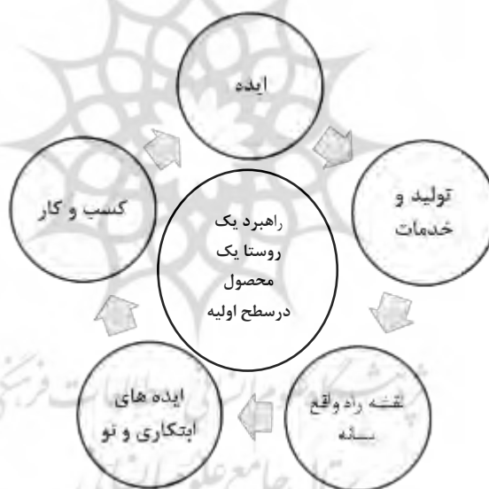
شکل ۳. مدل راهبرد یک روستا، یک محصول در سطح اولیه مستخرج از تجارب جهانی

در سطح اصلی و اولیه که اصلی‌ترین مرحله است، جامعه روستایی باید محصولی ارزشمند از نظر اقتصادی را پیدا کرده و تولید نماید، در این مرحله، خود فرد باید شروع کند یعنی این راهبرد از پایین به بالا است. بدین صورت: برای رسیدن به یک بینش و ایده برتر اول: ایده‌های اصلی و برتر را در نظر می‌گیریم دوم: با انتخاب روش‌های عملکردی مناسب، محصولات خوب و با کیفیت را انتخاب می‌کنیم، یعنی همان انتخاب گنجینه بومی سوم: برای کسب و کار مورد نظر راه‌ها و برنامه‌های عملی در نظر گرفته و به یادگیری و خودآموزی از دیگران می‌پردازیم، چهارم: دنبال واسطه‌ها می‌رویم و از همکاران و واسطه‌های اجتماعی سراسری استفاده می‌کنیم و در نهایت (پنجم)، با سرمایه‌گذاری‌های بلندمدت کالا و خدمات ابتکاری و جدید کسب و کارمان را ایجاد می‌کنیم. وقتی کسب کار ایجاد شود این چرخه ادامه می‌یابد و فکرهای جدید مرتبط با کسب و کار می‌آیند و به همین ترتیب کسب و کارهای دیگر و مرتبط را ایجاد می‌کنند و در نهایت در روستایمان چندین محصول فرآوری شده و دارای ارزش افزوده بالاتر نسبت به محصول اولیه و خام ایجاد می‌شود که روز به روز گسترده‌تر شده و بازار منطقه و حتی جهانی را در دست می‌گیرد. مراحل که در راهبرد اولیه (ایجاد کسب و کار) طی می‌شود در شکل ۳ نمایش داده شده است (Ndione, 2017: 155).