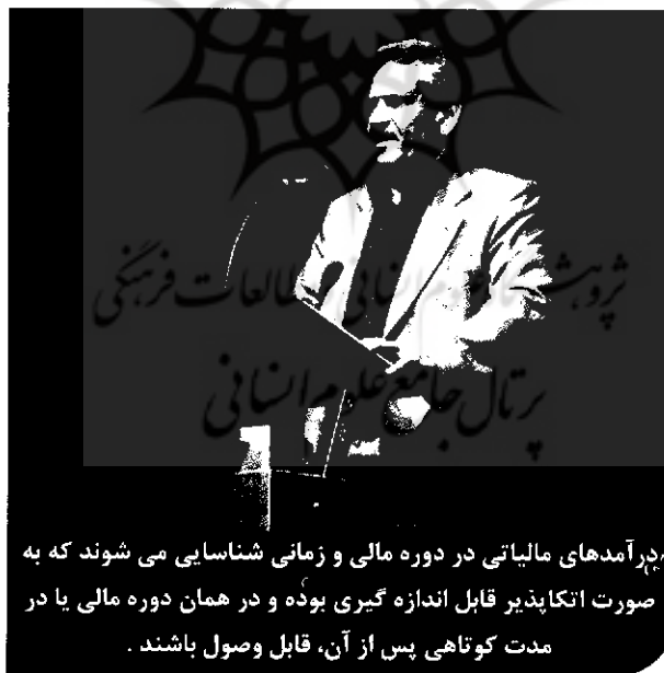
درآمدهای مالیاتی در دوره مالی و زمانی شناسایی می شوند که به صورت اتکاپذیر قابل اندازه گیری بوده و در همان دوره مالی یا در مدت کوتاهی پس از آن، قابل وصول باشند.

درآمدهای مالیاتی از یک سو و وجود مشکلات فراوان در دستیابی به مبنای تعهدی کامل (full accrual basis) از دیگر سو، موجب شده است تا اغلب کشورهای توسعه یافته و بعضا در حال توسعه از مبنایی دیگر موسوم به تعهدی تعدیل شده (modified accrual basis) در نگهداری حساب و