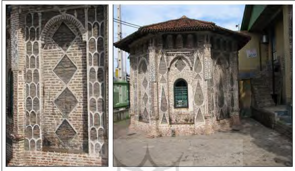
شکل ۵. امامزاده قاسم

داخلی هر یک از اضلاع آن طاق‌هایی ساخته شده است پهنای هر ضلع آن از داخل ۱۷۵ سانتیمتر است (شکل ۵).