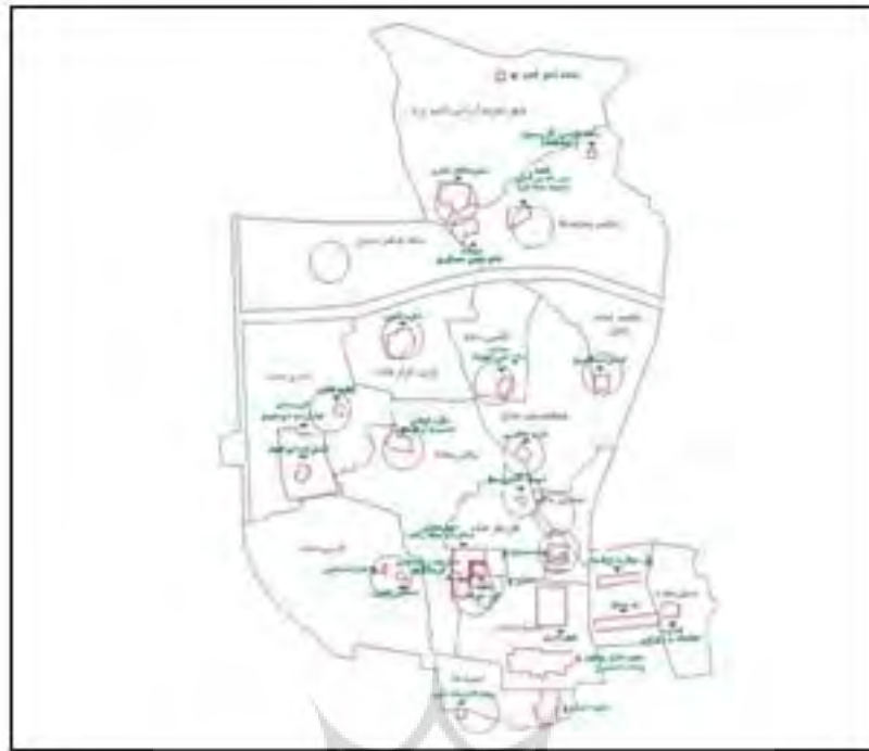
شکل ۲. عناصر تاریخی شاخص در بافت شهر