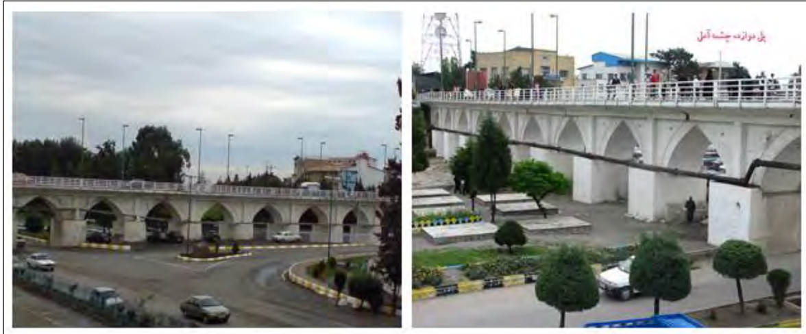
تصویر ۷. پل دوازده چشمه

قومی برخوردار بوده، بازار نیز از این نوع فرهنگ شهر بی‌تأثیر نبوده است. فهرست برخی راسته‌ها و تیمچه‌های موجود در بازار به این شرح است: راسته گروسی - راسته نیاکی (برنج فروشان) - راسته پالان دوزان - نو راسته - راسته هاشمی - راسته پایین بازار - راسته عطاران - راسته نمد مالان - راسته صالحی نژاد - راسته مسجد آقا عباس - تیمچه اول - تیمچه دوم - تیمچه سوم.