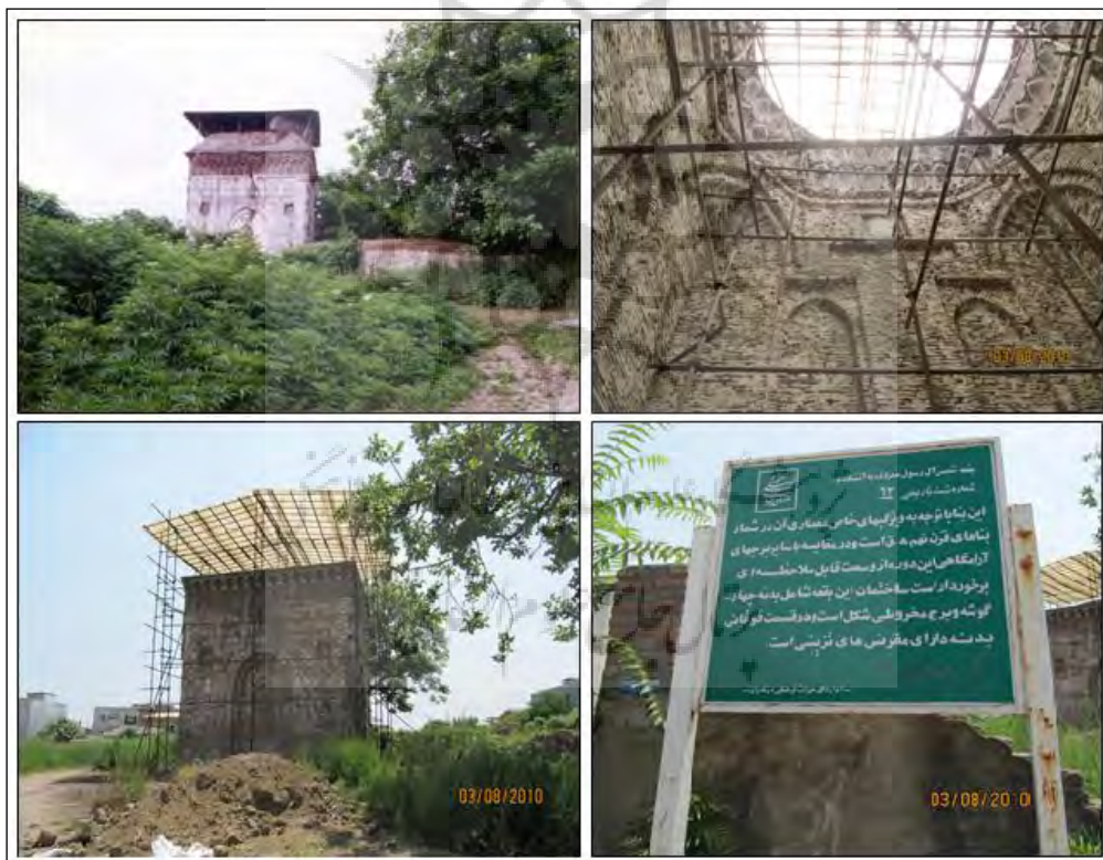
شکل ۴. مقبره آل رسول

مقبره شمس آل رسول: این بنا در محله پایین بازار در داخل حریم شهر قدیم آمل قرار دارد (شکل