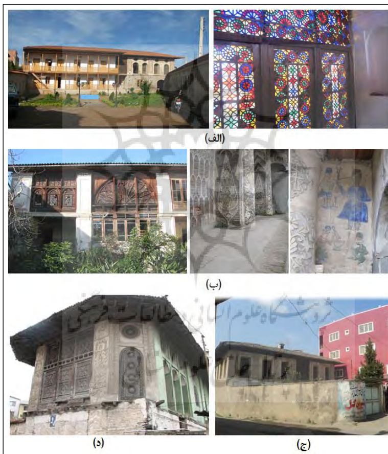
شکل ۸. خانه‌های تاریخی آمل (الف: خانه منوچهری؛ ب: خانه مدنی؛ ج: خانه ملک؛ د: خانه شفایی)

خانه ملک: از دیگر خانه‌های قاچاری در نیای محله کوچه به سمت امامزاده ابراهیم، جنب خانه قریشی در بافت قدیم شهر آمل که از نظر دسترسی به بازار و مرکز شهر در حد مطلوب قرار دارد واقع گردیده است. زمان ساخت آن به سال ۱۲۹۰ ه.ق.