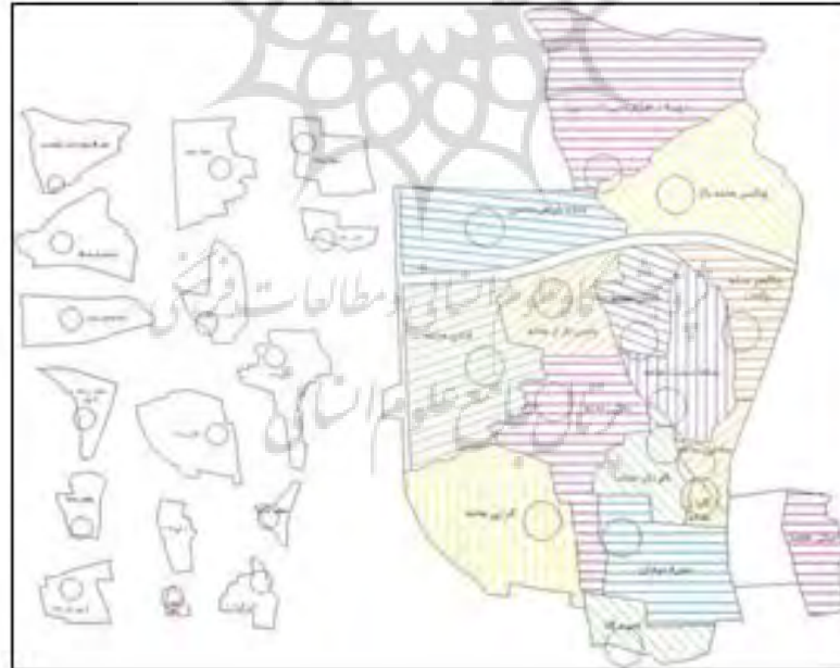
شکل ۳. موقعیت محلات در بافت قدیم

قرار دارد. به استناد ابن اسفندیار مسجد جامع به ایام هارون الرشید، سنه سبع و سبعین و مائه (۱۷۷)