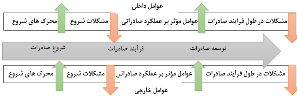
شکل ۱. چارچوب جامع بسترسازی توسعه صادرات (ناطق و نیاکان، ۱۳۸۸: ۵۲)

فعالیت های تجاری بین الملل ایفا کنند. هدف از برنامه های توسعه صادرات را افزایش عملکرد صادراتی از طریق ارتقاء توانمندی ها، منابع، راهبردها و رقابت پذیری کلی بنگاه ها دانسته اند که در مقابل در ارتقاء عملکرد صادراتی انعکاس می یابند (Kim and Hemmert, 2016). برنامه توسعه صادرات می تواند افزایش درآمد خارجی یک کشور برای ارتقاء موازنه تجاری آن باشد (Mallick and Marques, 2017 ; Qu et al, 2025).