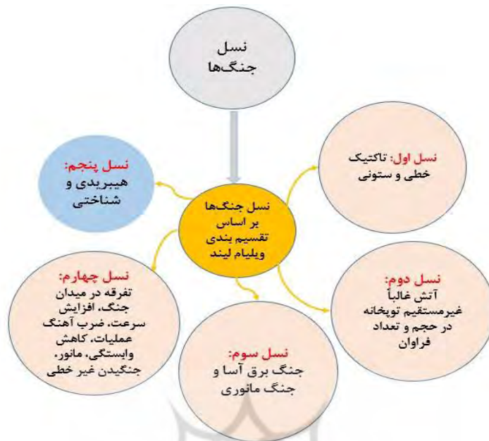
نمودار-۱. نسل جنگ‌ها بر اساس تقسیم‌بندی ویلیام لیند

نسل اول جنگ، دارای تاکتیک خطی و ستونی بود؛ نبردها در آن شکل مشخص داشتند و در میدان نبرد نظام تابعیت حاکم بود. نسل دوم، با استفاده از آتش غالباً غیرمستقیم توپخانه در حجم و تعداد فراوان صورت می‌گرفت. هدف آن فرسایش نیروهای دشمن و دکترین آن بود. نسل سوم، محصول جنگ جهانی اول است. ارتش آلمان طراح آن به شمار می‌رود و به جنگ برق آسا و جنگ مانوری معروف است. این جنگ بیشتر بر سرعت، غافلگیری، عوامل روانی و همچنین جابجایی فیزیکی متکی بود. نسل چهارم، بیشتر بر روی تفرقه در میدان جنگ، افزایش سرعت، ضرب آهنگ عملیات، کاهش وابستگی، مانور، جنگیدن غیر خطی و... تمرکز دارد. مرجع آن فقط دولت نیست و دنیای فرهنگ‌ها را در بر می‌گیرد (Ghasemi & Esmaili Farzin, 2017: 60-62). اما در حال حاضر دنیا با نسل جدیدی (نسل پنجم) از جنگ‌ها روبرو می‌باشد که در ادامه به دو تا از مهم‌ترین آن‌ها که مورد نظر نویسندگان می‌باشد، پرداخته خواهد شد: