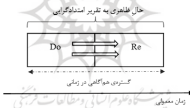
شکل ۲. ساختار یک حالِ ظاهری از دیدگاه مدل امتدادی

اجزاء زمانی تجربه در حالِ ظاهری وحدت در زمانی دارند و محتوای آنها باهم تجربه شده‌اند. وحدت در زمانی اجزاء زمانی حالِ ظاهری محصول رابطه‌ای پایه و منحصر به فرد تحت عنوان هم‌آگاهی در زمانی (Diachronic co-consciousness) است. هم‌آگاهی در زمانی سبب می‌شود تا هر یک از اجزاء زمانی حالِ ظاهری با جزء دیگری از آن باهم ادراک شوند. هم‌آگاهی یک رابطه متقارن (Symmetrical) و دوسویه (Mutual) است؛ بدین معنا که اگر نت‌های Do-Re یک توالی باشند و نت Do با نت Re هم‌آگاه بود، پس نت Re هم با نت Do هم‌آگاه است (۱۹). اما در موارد در زمانی، هم‌آگاهی یک رابطه متعدی (Transitive) نیست؛ هرچند در موارد هم‌زمانی (Synchronic) این رابطه متعدی است. مثلاً، توالی سه نت Do-Re-Mi را در نظر بگیرید. نت Do با نت Re هم‌آگاه است و نت Re با نت Mi هم‌آگاه است، واضح است که توالی فوق در امتداد زمان رخ داده است و لذا نمی‌توان گفت نت Do با نت Mi هم‌آگاه است. به عبارت دیگر، هم‌آگاهی به این دو نت تعدی پیدا نمی‌کند. بر خلاف موارد در زمانی، اگر هم‌آگاهی رابطه‌ای باشد بین اجزاء هم‌زمان می‌توان گفت هم‌آگاهی بین اجزاء متصل به هم متعدی است (۱۹). شکل ۲ تصویرگر یک حالِ ظاهری است: