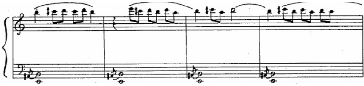
تصویر ۹. میزان‌های ۲۷۸-۲۸۴. مأخذ: Aslanian, 1943