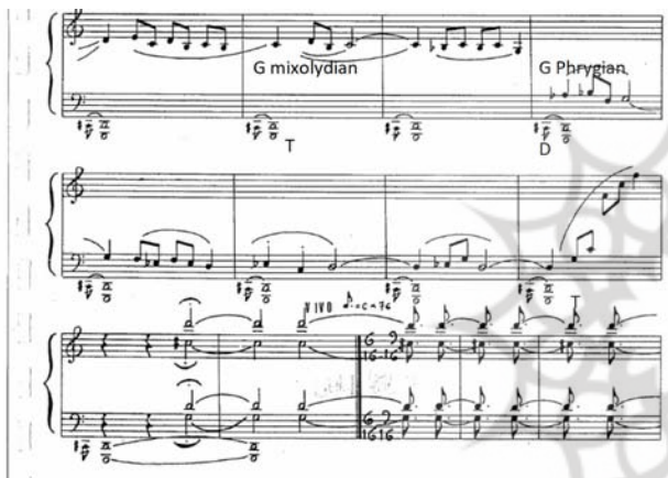
تصویر ۶. بخش پایانی B و ایجاد فرمول کادانسی با به کارگیری تضاد مدال.

در طبقه‌بندی خود برای آکوردهای اصلی لیدین، علاوه بر تونیک، آکوردهای دارای نت چهارم افزوده نسبت به تونیک را آکوردهای اصلی می‌داند. مثلاً در لیدین دو با نت شاخص فادیز، آکوردهای اصلی علاوه بر تونیک، آکوردهای درجه دو (ر، فادیز، لا) و درجه هفت (سی، ر، فادیز) می‌شود. البته پرسی کتی، آکورد درجه چهار دارای پنجم کاسته (یا تریتون) را به دلیل تداعی فضای موسیقی تنال کنار می‌گذارد (ibid.). این مثال‌ها نشان می‌دهد خصلت لیدینی را چهارم افزوده بالای تونیک تقویت می‌کند.