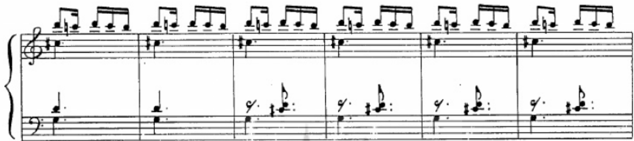
تصویر ۱۰. میزان‌های ۸۸-۹۳.