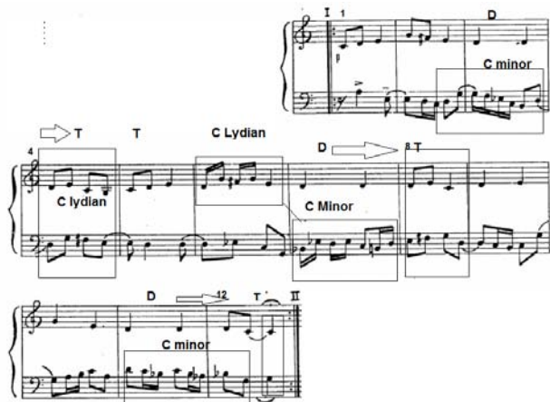
تصویر ۵. واریاسیون اول میزان‌های ۱۳-۲۴.