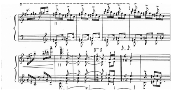
تصویر ۳. تداعی پنجم‌های پی‌درپی و چهارم‌های پی‌درپی در بخش C.