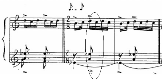
تصویر ۱۱. مقایسه سلول‌های اصلی سه قسمت از قطعه.

ندارد اما شکل‌دادن فرم قطعه حول نت ر که ریشه در مد اصلی دارد به نظر نوآورانه می‌رسد.