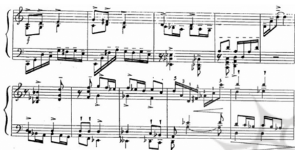
تصویر ۴. بخشی از واریاسیون بر روی تم دو لیدین و پیوندهای هارمونیک در واریاسیون.

میزان چهارم و پنجم را می‌توان مجدداً در لیدین دو تعبیر کرد. پرش‌های ملودیک متأثر از ساختارهای آکوردی و به صورت چهارم و پنجم درست هستند و سوم آکورد به وضوح حذف شده تا فضاگذاری کوارتال - کویینتال تقویت شود. میزان ششم و هفتم نیز فضاگذاری پنجم‌های پی‌درپی را مشابه میزان سوم نشان می‌دهد. لازم به ذکر است تغییرات بستر صوتی و ایجاد تضاد روی نت ر انجام شده است که خود تأکیدی بر اهمیت نقش نت ر در قطعه است (تصویر ۴).